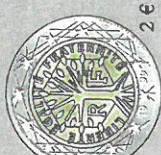
Marianne, la Semeuse et l'arbre de la Liberté.